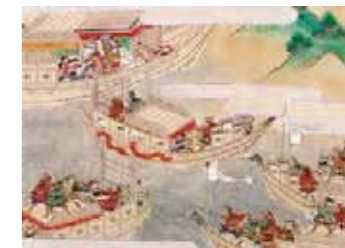
『平家物語絵巻』 林原美術館蔵

中世には多くの絵巻物が作成されました。当該期は天皇・貴族から武家(平氏・源氏)が力を持つようになり、院(上皇・法皇)による院政が開始され、新しく台頭しつつある武家に対し政治的対応がなされました。大きな時代変革の中で絵巻物が作成された意義を考えます。今回は近世に作成された絵巻物である『平家物語絵巻』を取り上げ、中世の諸史料によりながら史実に迫ります。