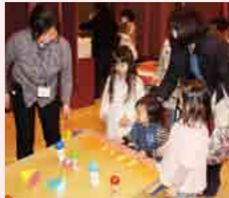
入る場所で貰えるお菓子の数が違います