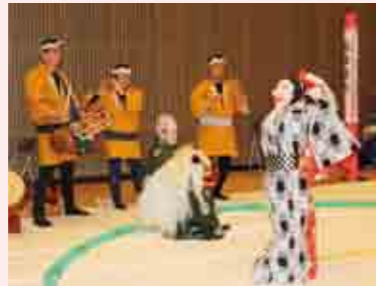
お囃子に獅子舞が正月気分を盛り上げました