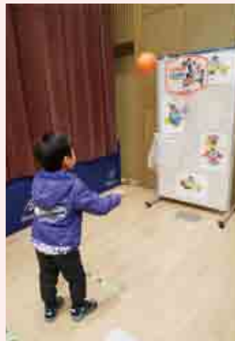
野菜がもらえるバスケゲーム