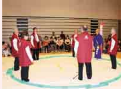
土俵の上でハ〜・ドスコイ