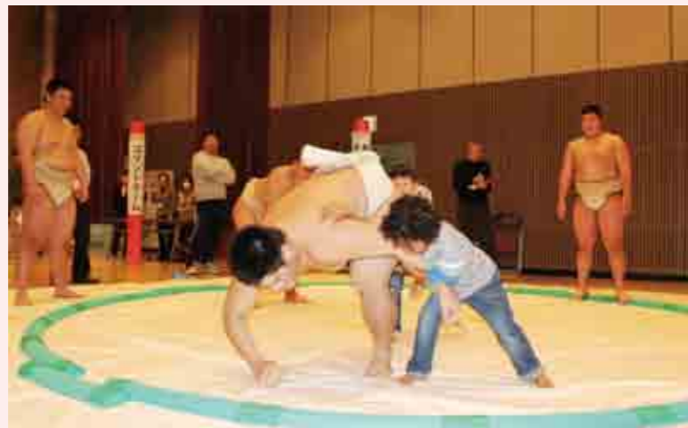
二人がかりで高校生を投げ飛ばす