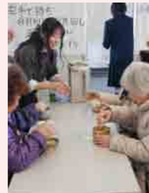
高校生の指導で真剣に