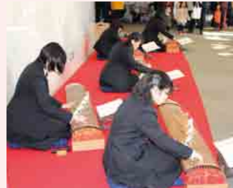
あでやかで華やかなお琴の演奏