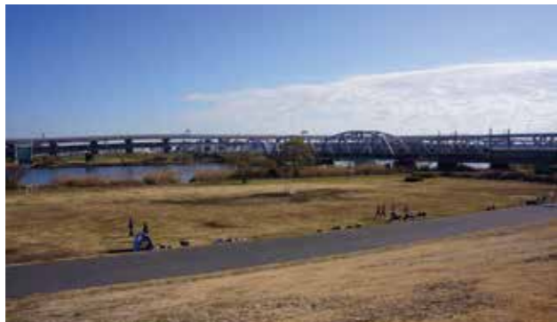
荒川土手からの風景