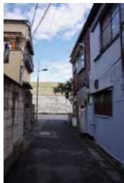
路地の先には荒川の土手