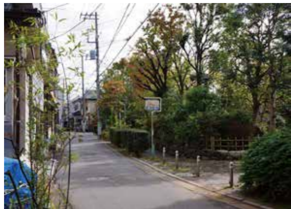
柳原千草園前の路地