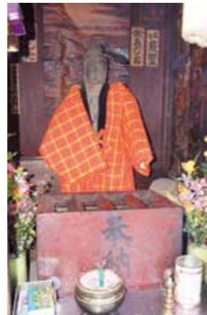
東武ガード近くの小さなお堂の中 赤いどてらで観音様も冬支度