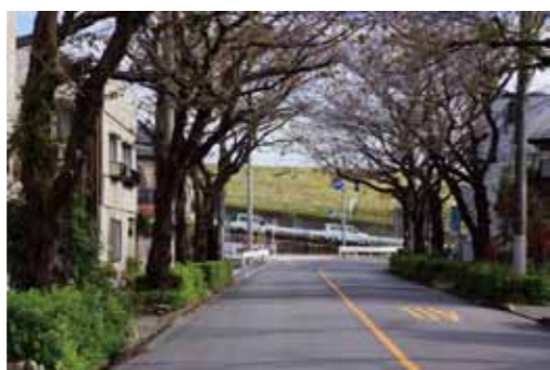
桜並木の向こうはすぐ荒川土手