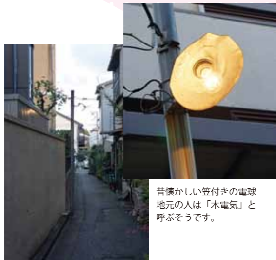
昔懐かしい笠付きの電球 地元の人々は「木電気」と 呼ぶそうです。