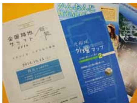
全国路地サミット配布物