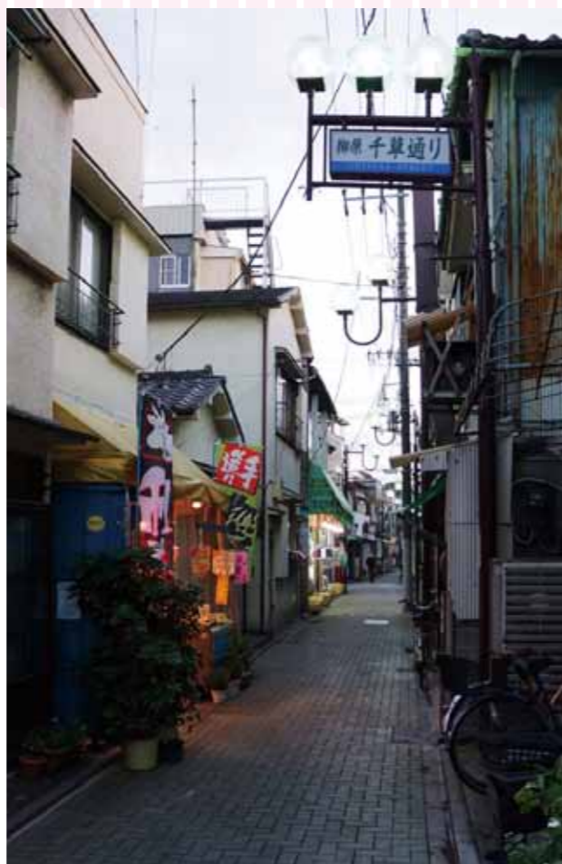
柳原千草通り商店街