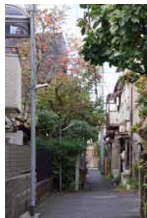
柿がなりはじめていました。