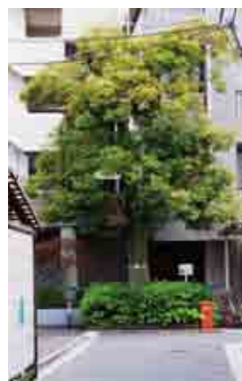
荒川放水路掘削時に移植されたスタジイの樹