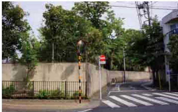
清亮寺の堀に沿って進みます