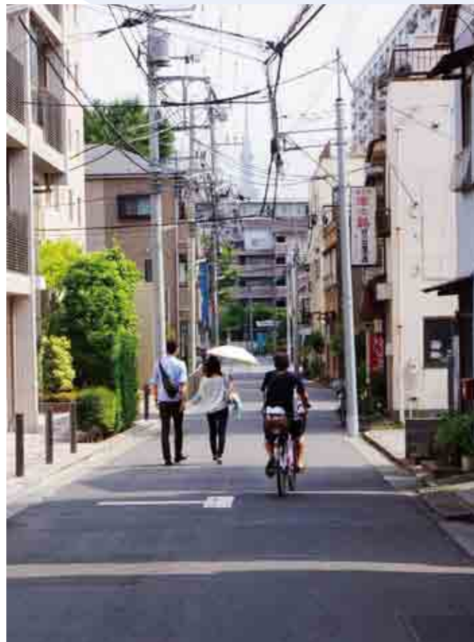
日ノ出神社の角を右に曲がると路地の先にスカイツリー