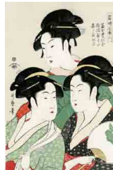
喜多川歌麿 『當時三美人』